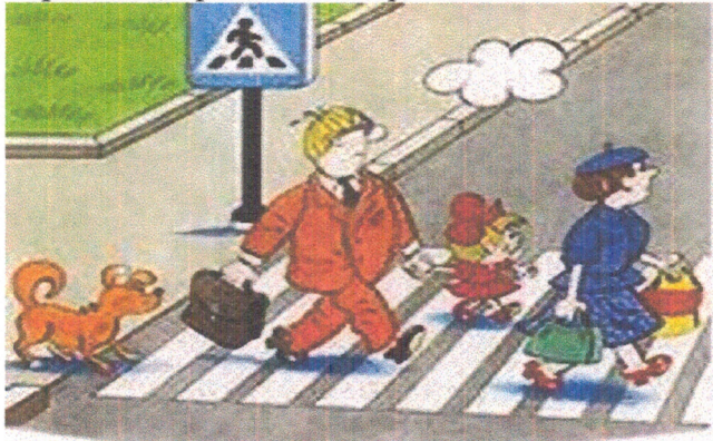
Ребенок должен знать!

Учить детей необходимо с самого раннего возраста не только соблюдать правила дорожного движения, но и наблюдать за дорогой. Нужно учитывать, что основные способы формирования навыков безопасного поведения у детей – наблюдение, подражание взрослым, прежде всего родителям.